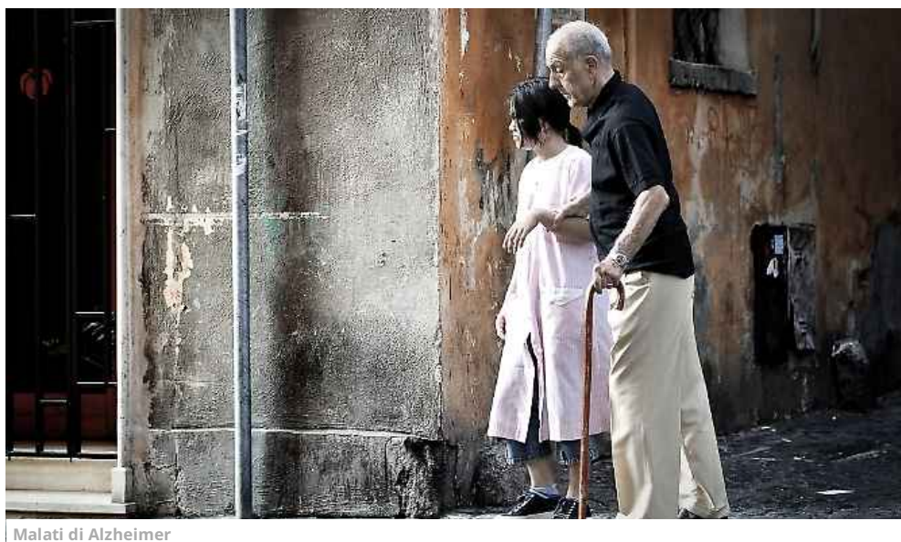
Malati di Alzheimer