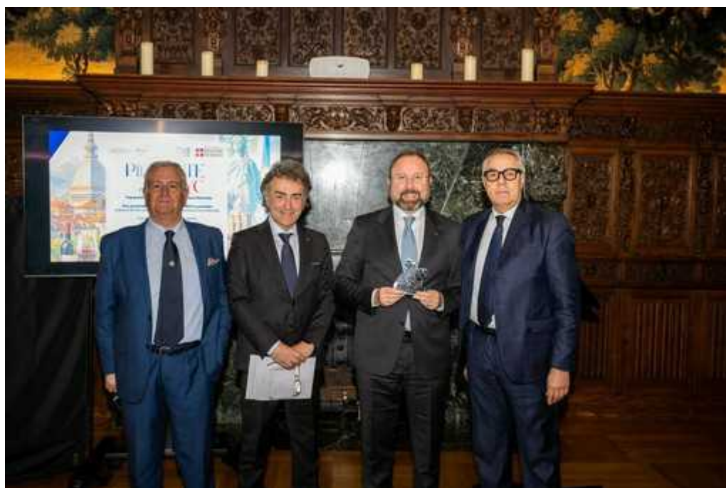
Eccellenza artigiana, "Piemonte chiama New York", protagonisti Confartigianato e A.N.Co.S. FOTO e VIDEO

Il progetto prevede inoltre il coinvolgimento del Consolato Generale d'Italia a New York e dell'Istituto Italiano di Cultura di New York